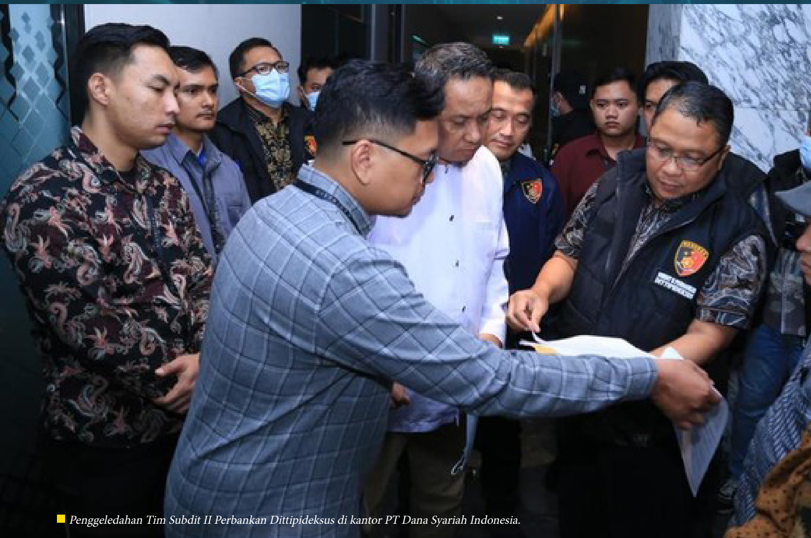
■ Penggeledahan Tim Subdit II Perbankan Dittipideksus di kantor PT Dana Syariah Indonesia.

Data tersebut kemudian ditampilkan dalam platform digital PT DSI untuk menarik minat investor. “Itulah yang kemudian membuat para lender tertarik, bahwa ada proyek-proyek yang membutuhkan pembiayaan dan