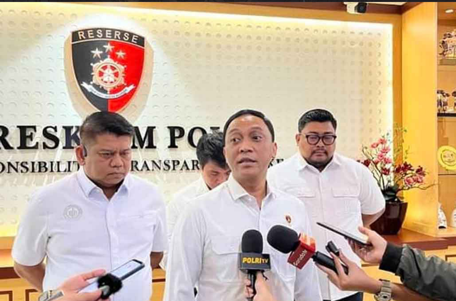
■ Direktur Tindak Pidana Narkoba Bareskrim Polri Brigjen Pol. Eko Hadi Santoso

"Kepolisian Negara Republik Indonesia sekali lagi menegaskan komitmennya untuk tidak menoleransi segala bentuk penyalahgunaan narkotika dan psikotropika, baik yang dilakukan oleh masyarakat maupun oleh oknum internal Polri," ujarnya di Mabes Polri.