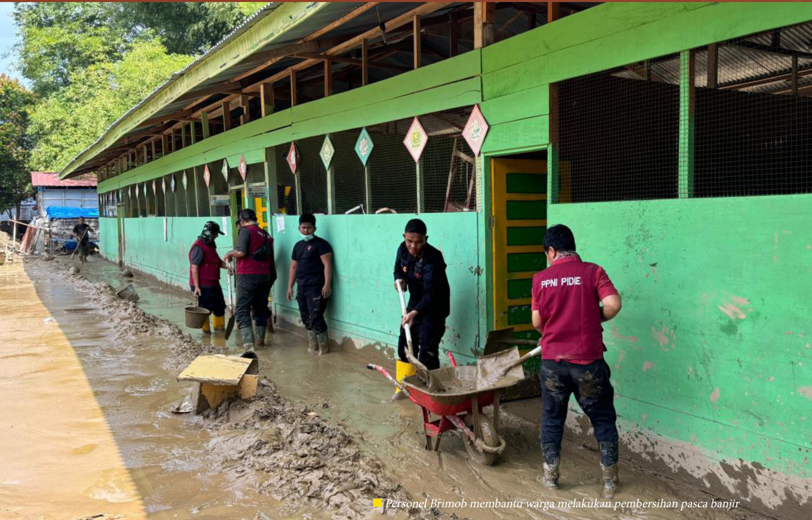
■ Personel Brimob membantu warga melakukan pembersihan pasca banjir

“Kami mendukung penuh seluruh personel dan peralatan yang diturunkan. Kehadiran Brimob diharapkan meringankan beban masyarakat dan mempercepat pemulihan pascabencana,”