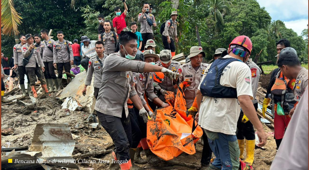
■ Bencana banjir di wilayah Cilacap, Jawa Tengah