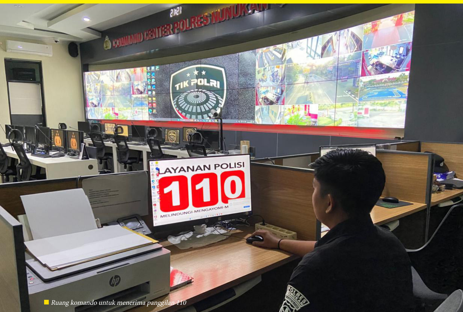
■ Ruang komando untuk menerima panggilan 110

disampaikan. Karena di negara lain, menyalahgunakan layanan darurat adalah tindakan kriminal. Dan Indonesia, pelan tapi pasti, mulai menuju ke sana.