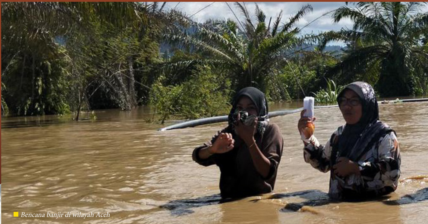
■ Bencana banjir di wilayah Aceh

Di Jambi, respons cepat dilakukan personel Kompi 3 Batalyon B Pelopor Satbrimob Polda Jambi di Desa Lubuk Suli, Kabupaten Kerinci. Ketika debit air meningkat, tim SAR diterjunkan mengevakuasi warga menggunakan perahu karet, dengan prioritas