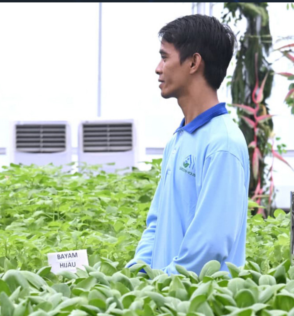
■ Kunjungan Presiden Prabowo Subianto ke SPPG didampingi Kapolri Jenderal Pol Listyo Sigit Prabowo

Untuk mendukung ketahanan pangan nasional, Polri juga membangun 18 gudang logistik di 12 Polda dengan kapasitas hingga 1.000 ton per gudang. Pada 2026, jumlah tersebut ditargetkan bertambah menjadi 28 gudang, termasuk fasilitas berkapasitas besar di wilayah Polda Metro Jaya.