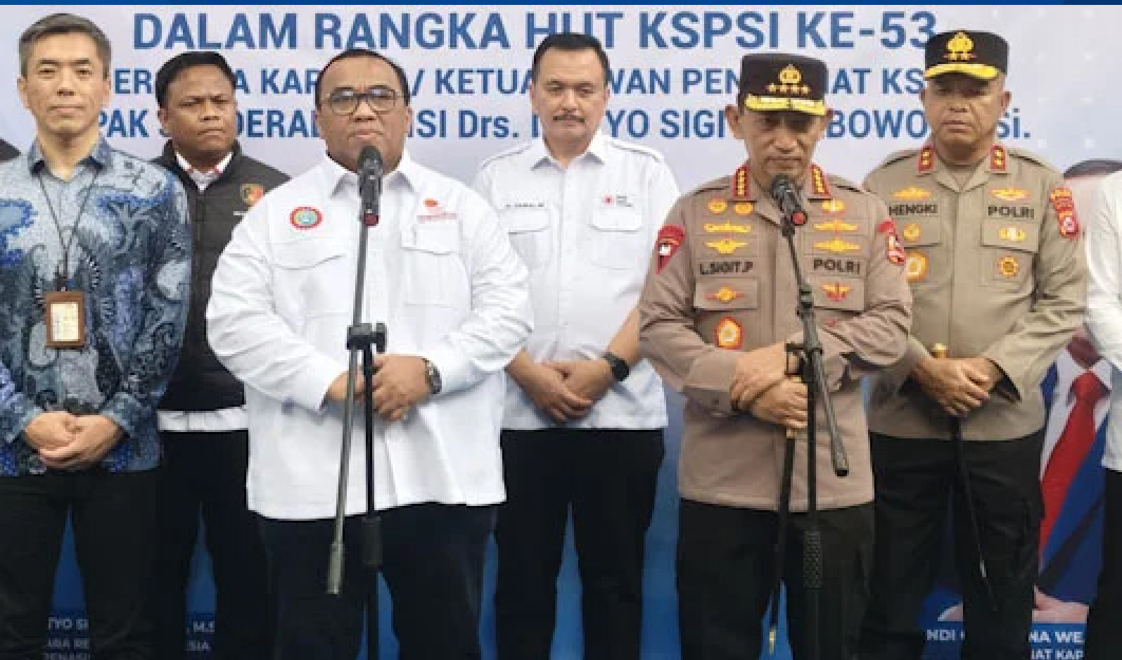
■ Kapolri Jenderal Listyo Sigit Prabowo saat menghadiri peringatan HUT ke-53 Konfederasi Serikat Pekerja Seluruh Indonesia (KSPSI)

D i tengah dinamika layanan kesehatan nasional, Kapolri Jenderal Listyo Sigit Prabowo meminta fasilitas kesehatan milik Polri dapat dimanfaatkan oleh buruh peserta BPJS Kesehatan. Pernyataan itu disampaikan saat menghadiri peringatan HUT ke-53 Konfederasi Serikat Pekerja Seluruh Indonesia (KSPSI) di Pasar Kemis, Kabupaten Tangerang.