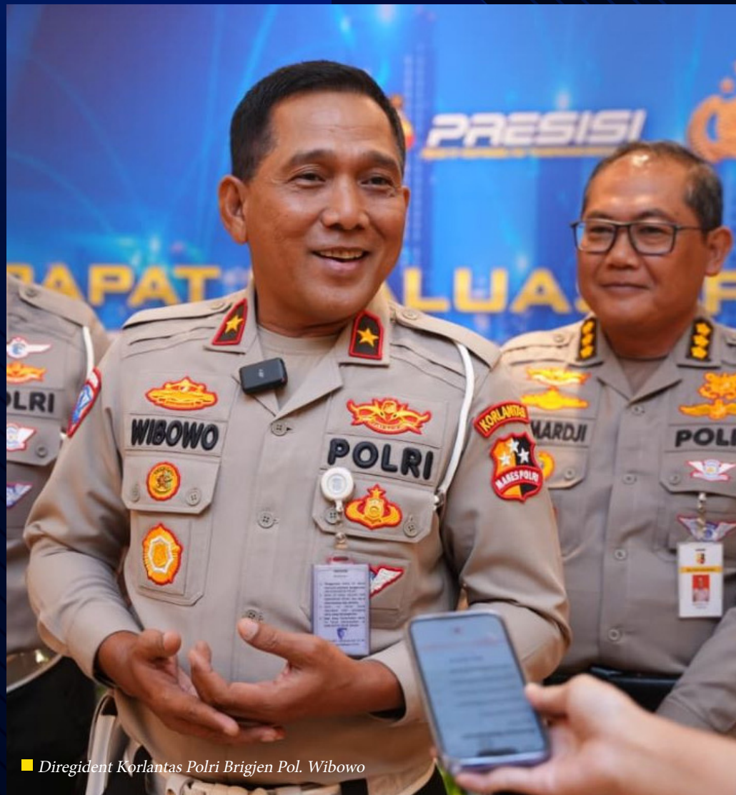
■ Diregident Korlantas Polri Brigjen Pol. Wibowo

Dukungan Penegakan Hukum Dari sisi operasional kepolisian, e-BPKB turut mendukung fungsi registrasi dan identifikasi kendaraan bermotor sebagai bagian penting dalam penegakan hukum. Akses terhadap data yang terintegrasi memungkinkan petugas melakukan verifikasi