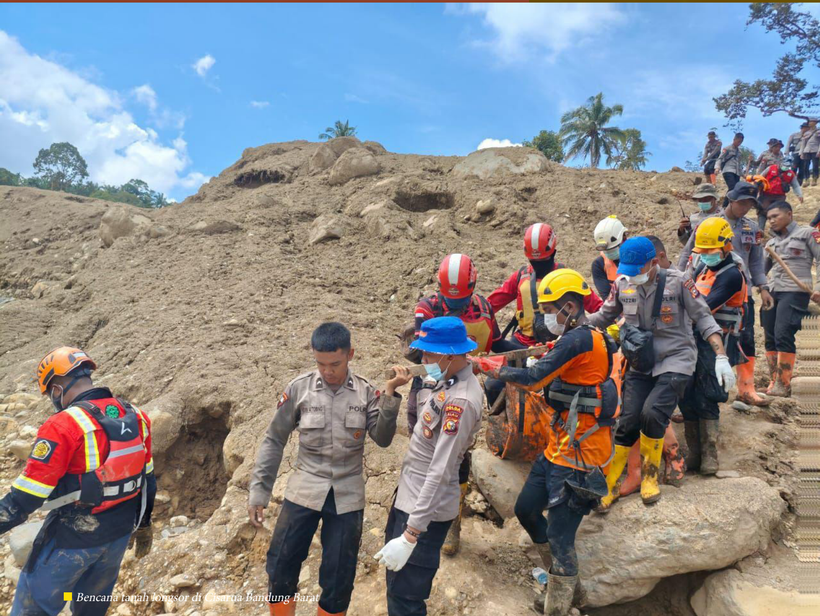
■ Bencana tanah longsor di Cisarua Bandung Barat

Hujan yang turun berhari-hari pada akhir 2025 menjadi awal dari rangkaian bencana di sejumlah wilayah Indonesia. Sungai meluap, lereng runtuh, dan gunung memuntahkan material vulkanik. Di tengah situasi itu, Korps Brimob Polri bergerak di banyak titik—dari Sumatra, Jawa Tengah, Jawa Timur, hingga Sulawesi Utara membawa satu misi yang sama: menyelamatkan dan memastikan warga tetap bertahan.