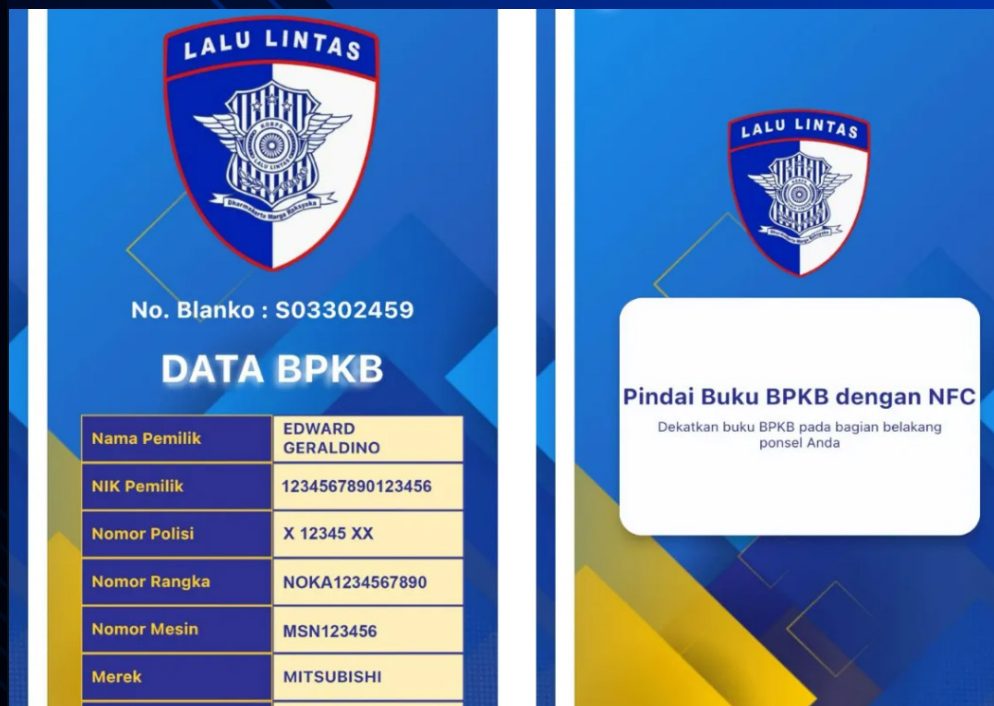
■ e-BPKB yang dilengkapi teknologi chip RFID (Radio Frequency Identification) dan QR Code (Quick Response Code)