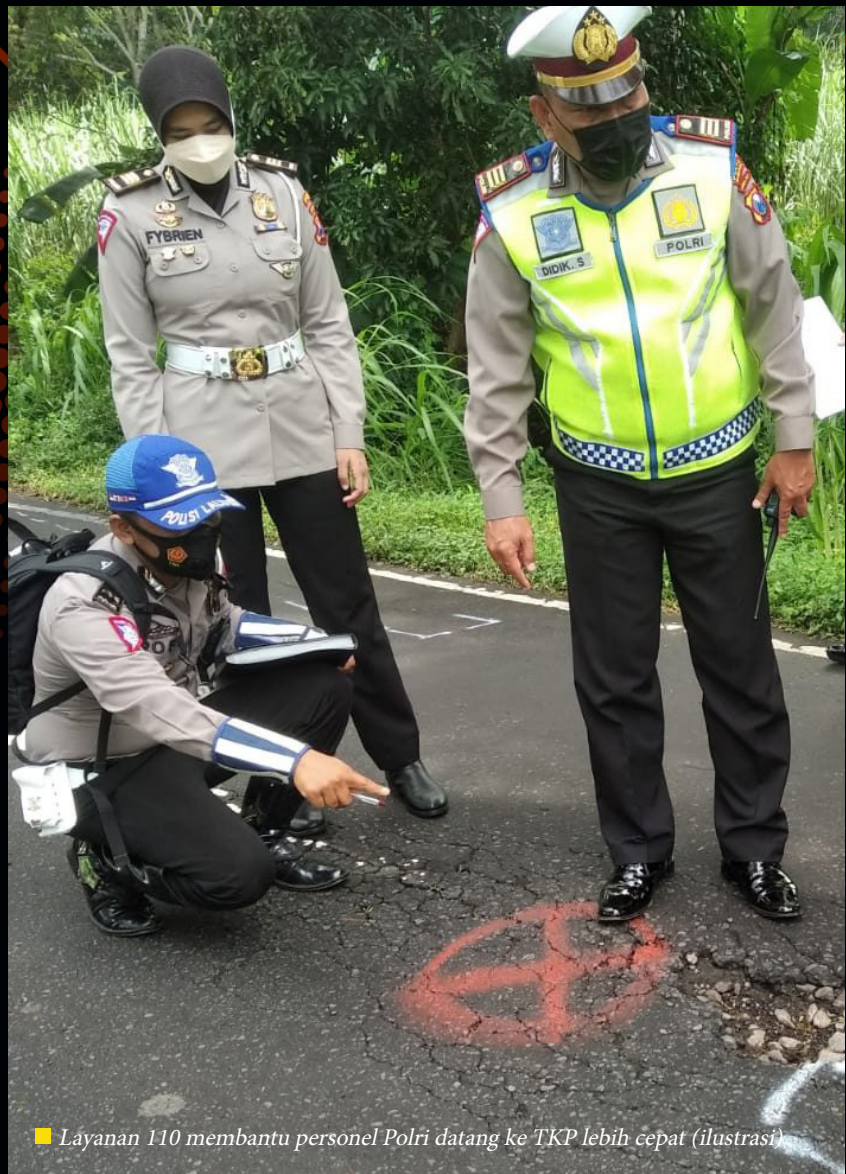
■ Layanan 110 membantu personel Polri datang ke TKP lebih cepat (ilustrasi)

• Polri tak tinggal diam. Imbauan terus digaungkan. Bahkan ancaman sanksi hukum pun