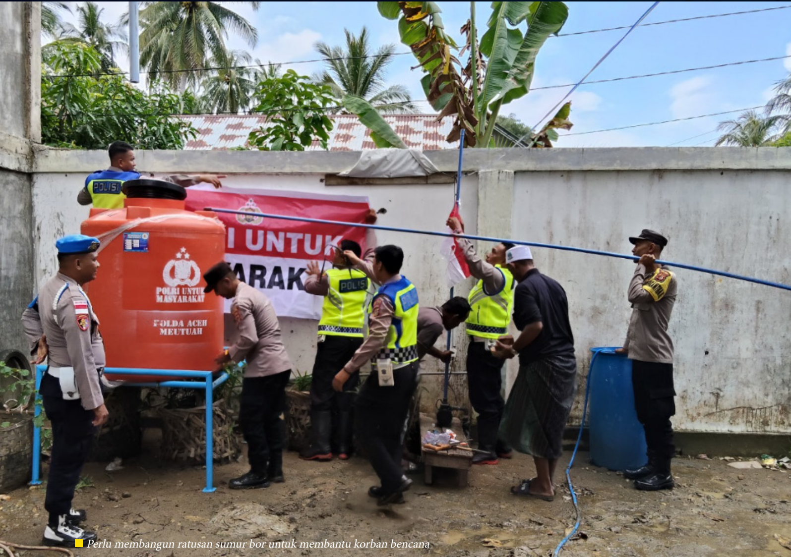
■ Perlu membangun ratusan sumur bor untuk membantu korban bencana

Program pembangunan sumur bor difokuskan pada tiga provinsi yang paling terdampak bencana, yakni Aceh, Sumatra Utara, dan Sumatra Barat, sebagai bagian dari upaya pemulihan kebutuhan dasar masyarakat pascabencana.