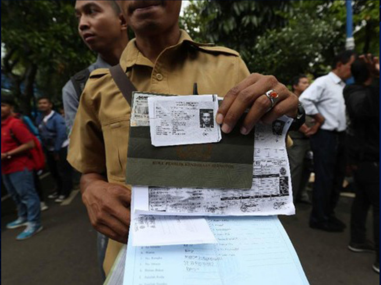
■ Pengurusan surat kenderaaan bermotor (Ilustrasi)

secara lebih cepat dan presisi, baik dalam pelayanan administrasi maupun kegiatan penyelidikan dan penyidikan yang berkaitan dengan kenderaaan bermotor.