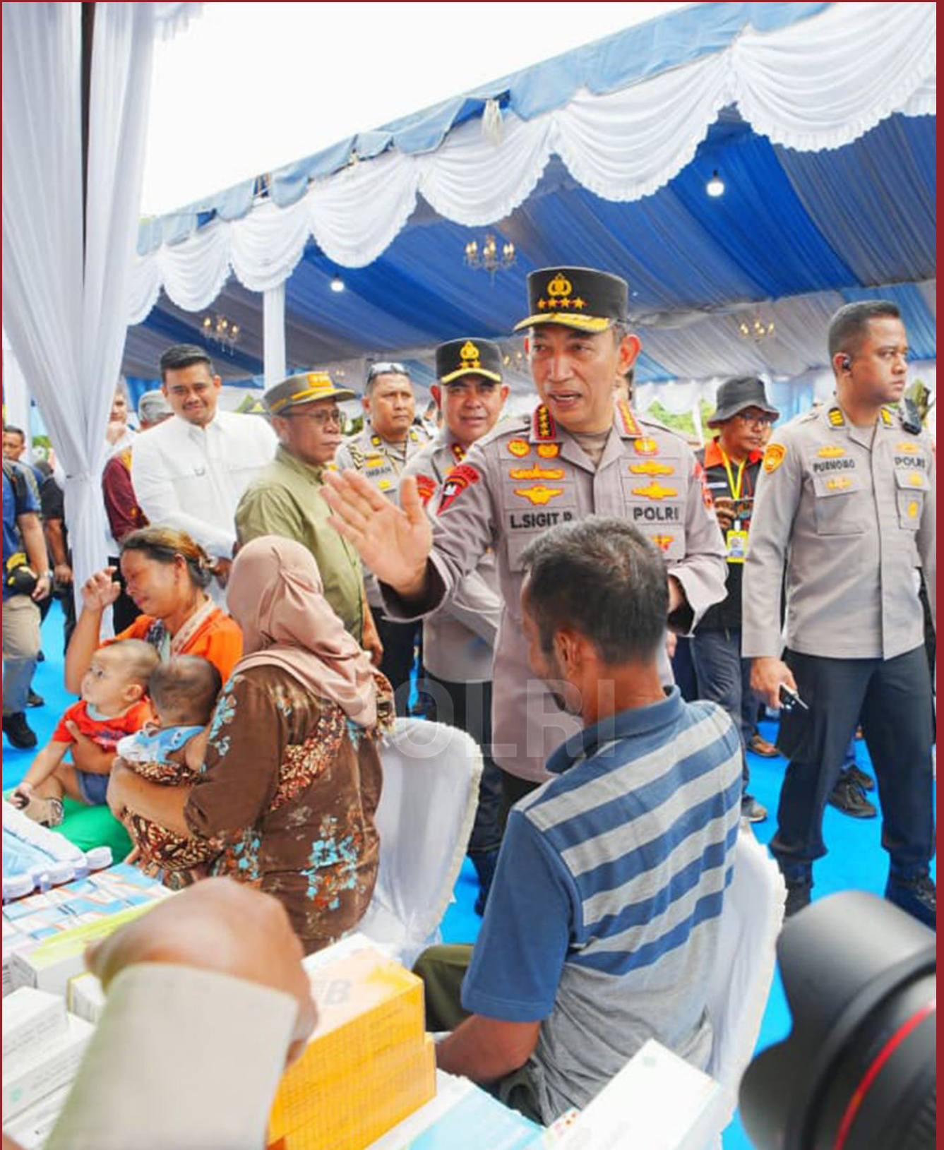
Pemulihan Pascabencana Tapanuli Tengah